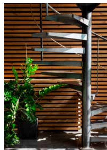
Een elegante stalen draaitrap verbindt beide etages. Die hebben elk hun eigen sfeer: wit als neutrale basiskleur in de B&B, donkere tinten bij Andrea thuis.

Peace in the City is allesbehalve een standaardhotelkamer. De handige keuken, voorzien van alles wat je nodig hebt, zit elegant verborgen achter een zwarte draaideur. In diezelfde box vind je ook de zwevende slaapkamer die heel wat hotelsuites doet verbleken. De groene kussens op het bed, de donkergroene tegeltjes in de badkamer en het tapijt in de woonkamer verwijzen subtiel naar de kleurenvoorkeur van de vrouw des huizes.