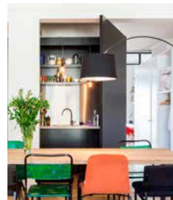
De compacte keuken gaat schuil achter een openklapbare wand.